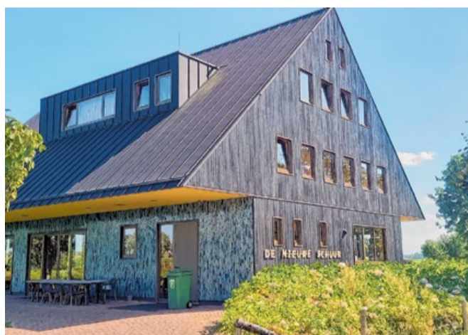
De Nieuwe Schuur, uit duurzaam hout opgetrokken.

Het loont de moeite ‘De Nieuwe Schuur’ te bezichtigen. De voor- en achtergevels zijn bekleed met zwart verkoold houten delen die met de Japanse Shou Sugi Ban-methode