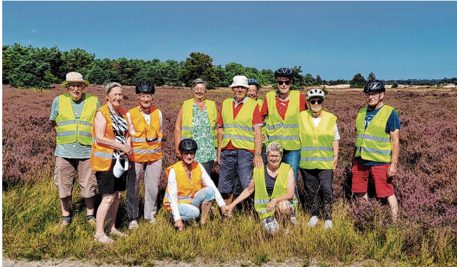
Fietsgroep van KBO Nieuwkuijk.

Vanaf woensdag 12 juni tot 28 augustus is KBO Nieuwkuijk met een wisselende groep van 9 tot 15 personen wekelijks gaan fietsen. Vorige week was het dus alweer de laatste keer dat de groep hun stalen ros besteeg. Een enkeling op een fiets zonder ondersteuning. Mensen zonder ondersteuning fietsen altijd