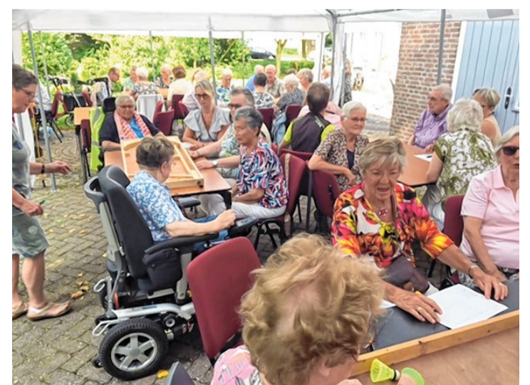
Oudhollandse tafelspellen druk bezocht.

afsluiten met eten. De deelnemers moesten flink aanpakken in een onderlinge competitie met de vele oudhollandse spellen. Tussendoor werd gezorgd voor hapjes en drankjes, maar het sluitstuk was het bezoek van de frietwagen. Met zo'n 60 deelnemers allemaal tegelijk aan de friet met snacks, dat was niet alleen lekker maar gaf een extra gezellig en saamhorig gevoel.