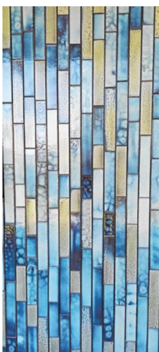
Koninklijke Tichelaar in Makkum maakte de door Francine Houben ontworpen geveltegels.